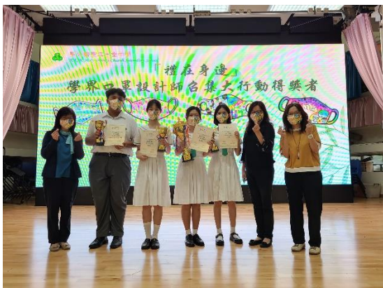
學界口罩設計比賽