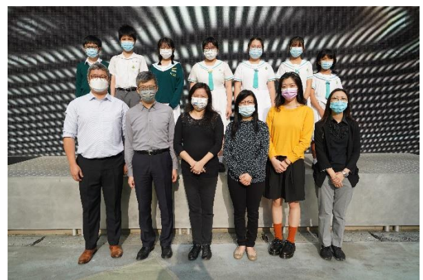
圖書館學生助理員