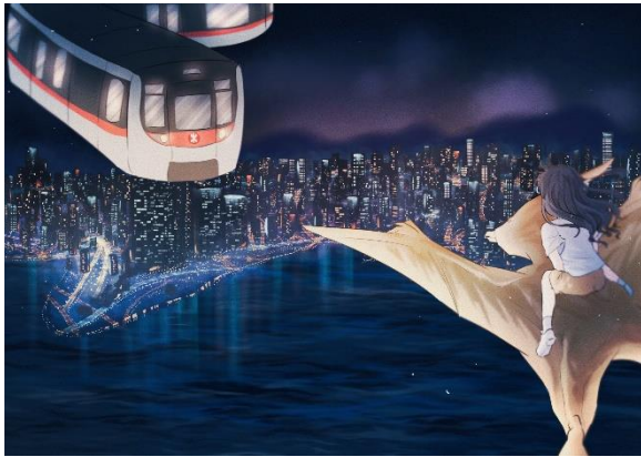
港鐵載遇恐龍創意繪畫比賽