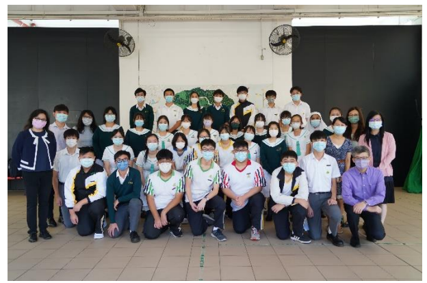
輔導組輔導員就職禮