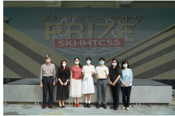
企業、會計及財務獎學金