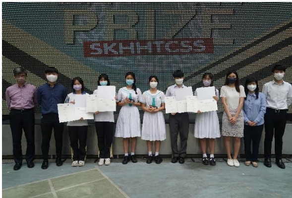
2021 青少年微電影營銷比賽頒獎