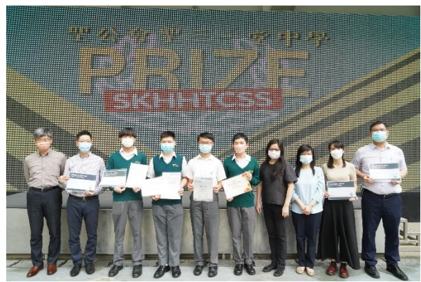
Microsoft 雲端 AI 基礎證書