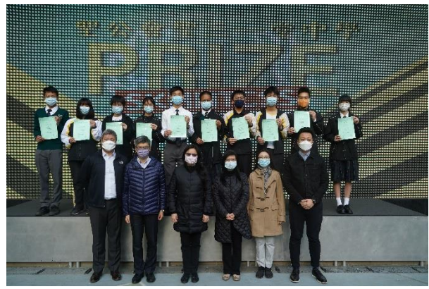
中國中學生作文比賽