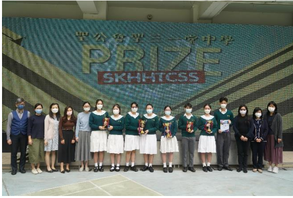
企業、會計及財務比賽