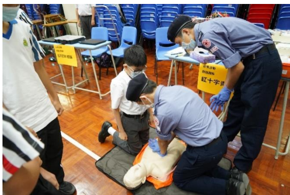
中一聯課活動—紅十字青年團救傷示範