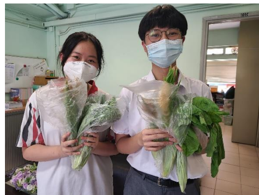
綠色大使收割校園耕種的蔬菜