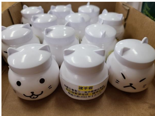
家長與同學一起做護手霜送給長者