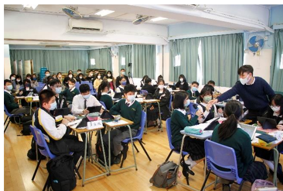
中二生活與社會科公開課