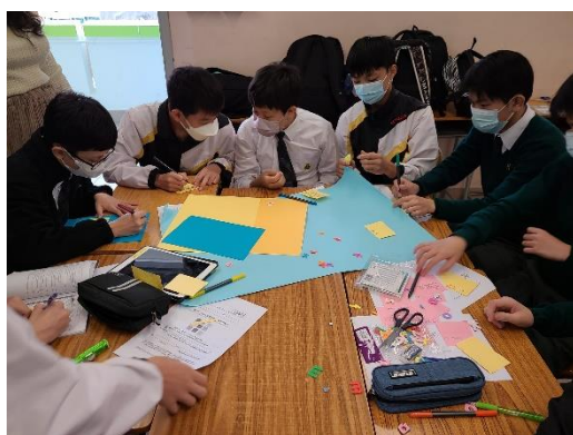
中二正向生命教育活動