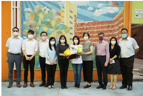
家長教師會在敬師日致送禮物給本校老師