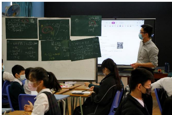
中一數學科公開課