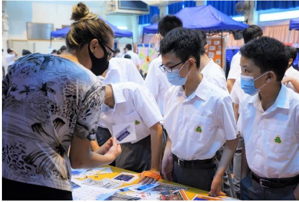
英語活動 “Back to School”