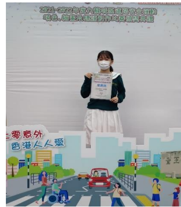
中學組道路安全標語創作比賽