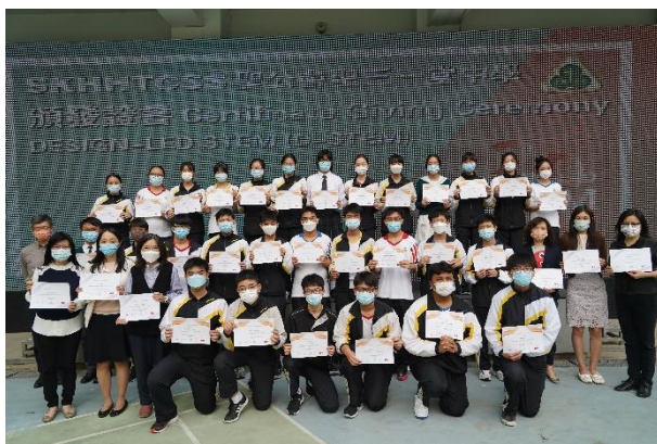
香港理工大學「D-STEM 設計」證書