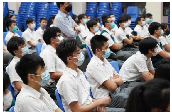
向學生簡介內地及台灣升學條件