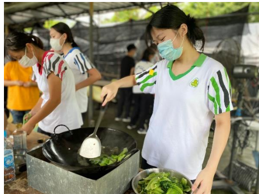
訓導組學長農務訓練