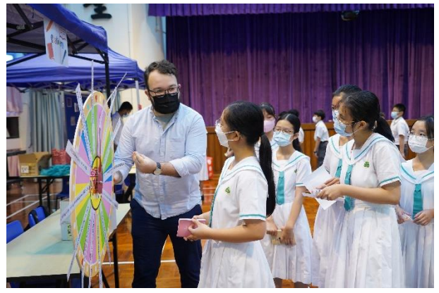
英語活動 “Back to School”