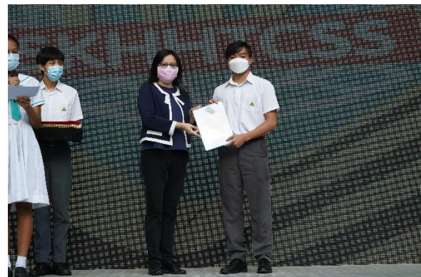
英文故事寫作比賽