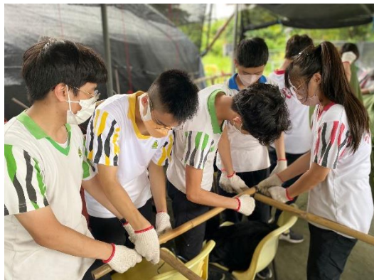
訓導組學長領袖訓練