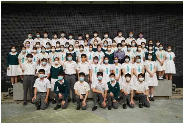
訓導組學生長就職禮