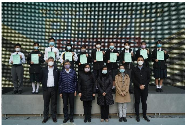
4·23 世界閱讀日創作比賽