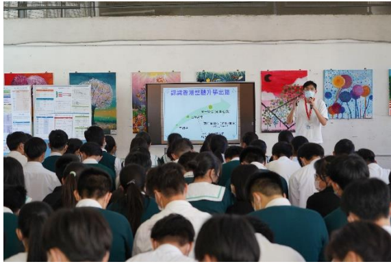
「認識香港升學出路」