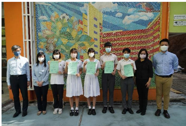
第十三屆中學生閱讀比賽