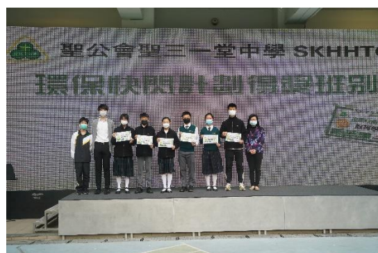
環保快閃計劃頒獎