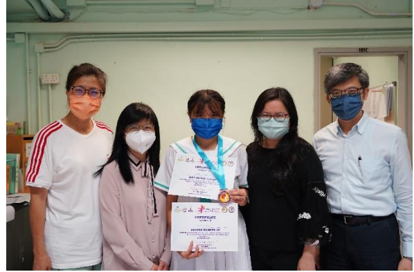
香港女子青年沙灘手球代表