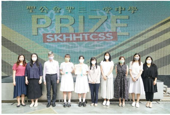
九龍城區傑出學生獎