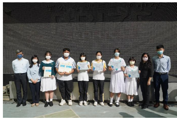
校際英文朗誦及書法比賽