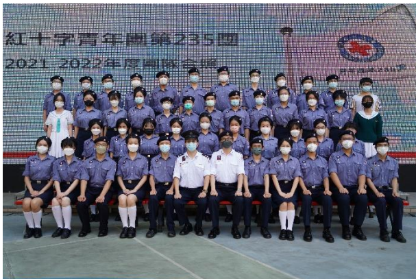
紅十字青年團委員