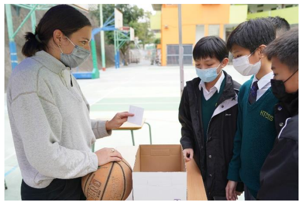
英語活動 “Sports Challenge Day”