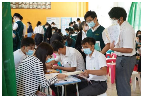
中六模擬放榜體驗活動