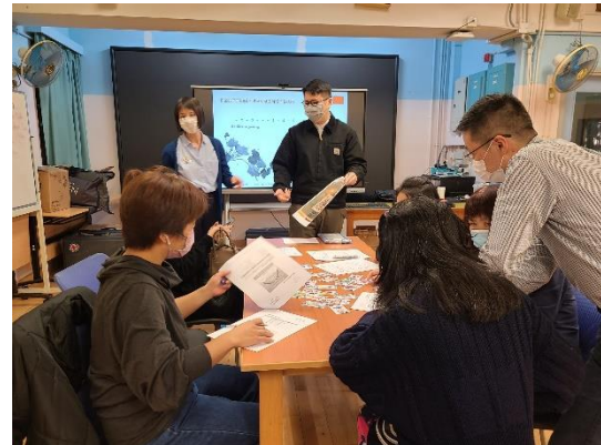
正向親子溝通技巧工作坊