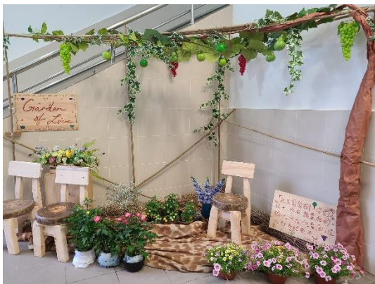
Garden of Love