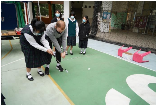
英語活動 “Sports Challenge Day”